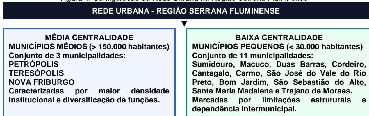
Figura 1. Configuração da Rede Urbana na Região Serrana Fluminense

O recorte espacial abrangeu 14 municípios da Região Serrana Fluminense, definidos a partir da convergência entre os recortes da Fundação CEPERJ (2024) e da Secretaria de Estado de Educação (2024). Os municípios foram agrupados em “média centralidade” e “baixa centralidade”, visando construir parâmetros comparáveis para análise das desigualdades territoriais na permanência escolar, segundo figura abaixo. 1